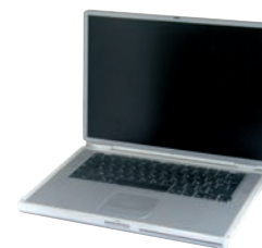
ORDINATEURS PORTABLES / ÉCRANS