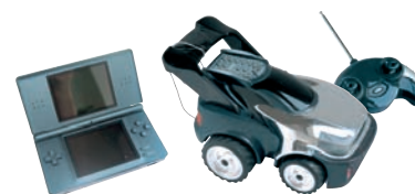
JOUETS / LOISIRS