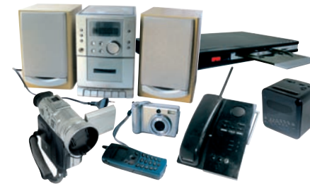
AUDIO / VIDÉO / TÉLÉPHONIE