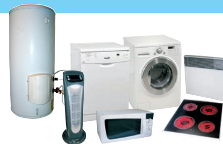
LAVAGE / CUISSON / CHAUFFAGE