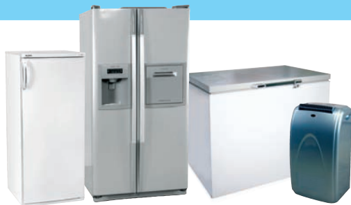
RÉFRIGÉRATEURS / CONGÉLATEURS / CLIMATISEURS