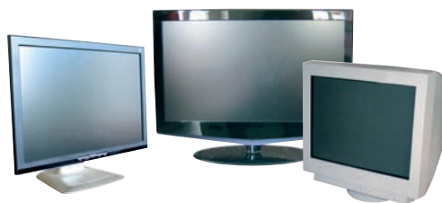
TÉLÉVISEURS / MONITEURS