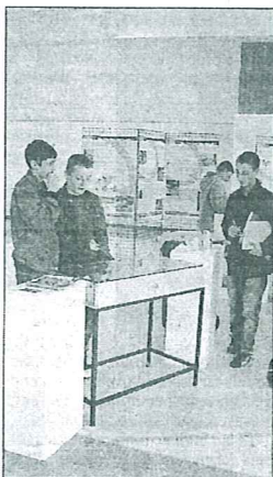
A Corbie, où l'exposition a été présentée durant quatre jours la semaine dernière, les collégiens de Sainte-Colette ont pu apprendre les bons gestes à avoir pour un tri de bonne qualité.

Si le tri est important, sa qualité est essentielle et c'est le rôle de l'ambassadrice du tri d'aider les "trieurs" et de répondre à leurs questions grâce à ses actions de sensibilisation comme cette exposition itinérante.